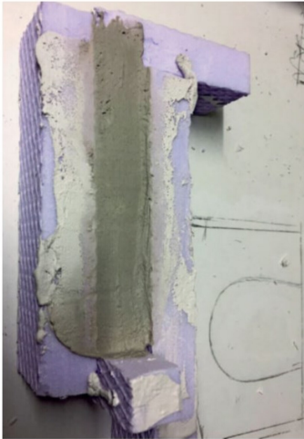
Gipsbauteile werden in Styrodurformen erstellt.