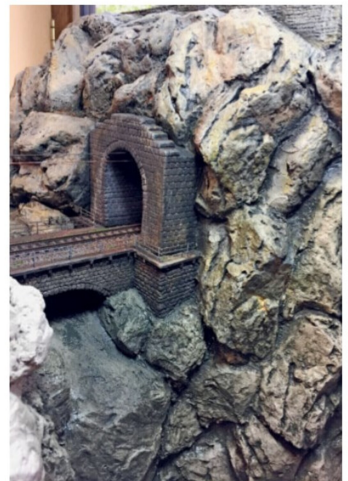
Eine Lasur sorgt für eine optische Felstiefe.