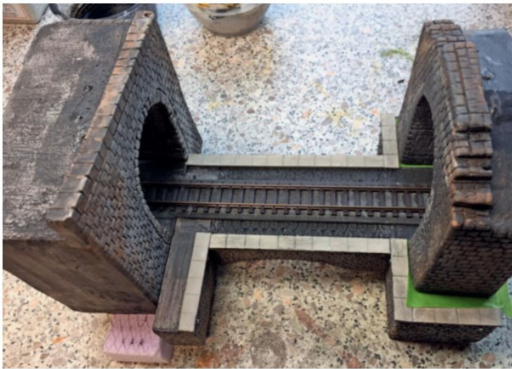
Die Kragplatten oberhalb der Mauerverbauungen werden sorgfältig aufgeklebt und im Anschluss ebenso sorgfältig farblich behandelt.