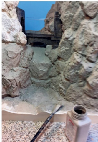
Die Felsen werden mit Heki-Granitfarbe bemalt.