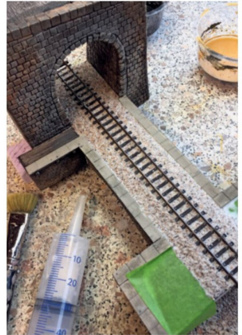
Das Gleis wird im Vorfeld eingeschottert.