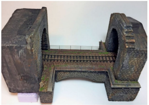
Erst am Schluss werden die beiden Seitengeländer auf dem Bauteil montiert und entsprechend gealtert. Jetzt folgt der Einbau des fertigen Bauteils.