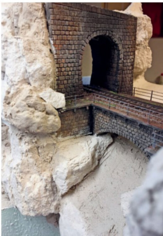
Das gesamte Bauteil wird ins Diorama eingefügt.