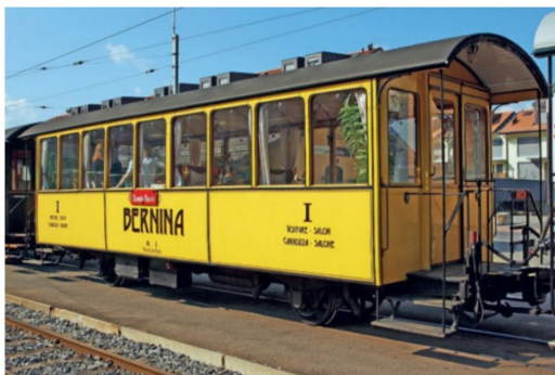
Der historische RhB-Salonwagen im Gelb der Berninabahn bei der BG.