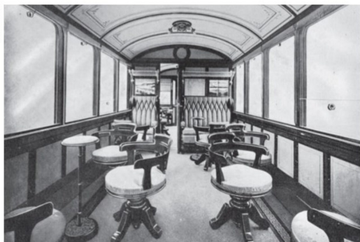
Eine Innenaufnahme der beiden RhB-Salonwagen As 2 und 3.