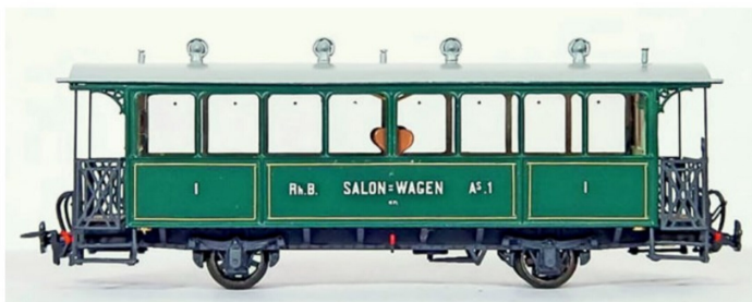
Die Seitenansicht des Modells vom RhB As 1 in Spur H0m von Motreno.