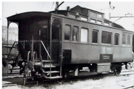
Zum SBB-Dienstwagen Xd 99878 umgebauter Salonwagen der SCB.