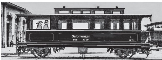
Zeichnerische Rückführung des Dienstwagens annähernd in den Ursprungszustand des SCB As 39.

fenen Pavillon und drei im Coupé am anderen Ende des Wagens. Die Hauptmasse des Salonwagens waren: Achsstand 5 m, Länge ü. P. 10,96 m.