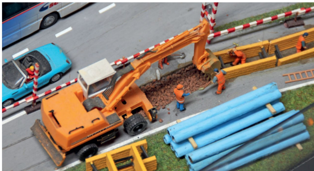
Ein weiteres liebevolles Detail der Anlage: Eine Tiefbaufirma erledigt die Grabarbeiten für das Verlegen der Wasserrohre.