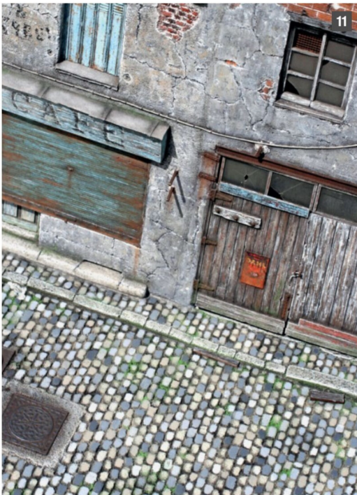
Bild 12: Zement oder Beton sind mittels Polyurethanschaum leicht zu simulierende Materialien. Insbesondere bei Bodendar-

Bild 11: Fokussierung auf einen Teil einer kleinen Sackgasse, die mit dieser Präge-