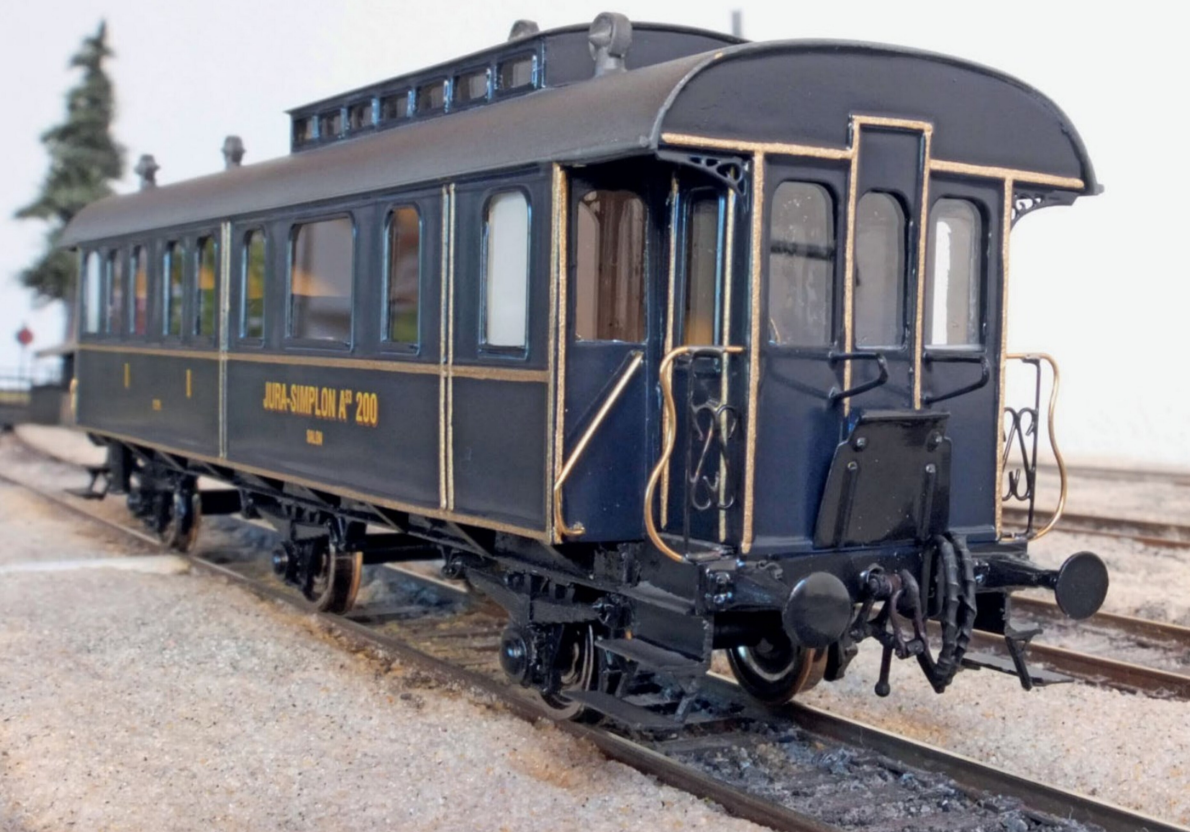
Ein tolles Stück: Die beiden Frontpartien mit den filigranen Gittern hat Christian Gohl total erneuert und die Radsätze gegen RP25 ausgetauscht.