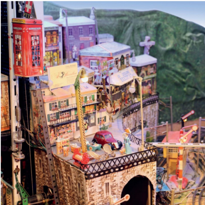
Das Modell im Modell: Detailsicht der Bebauung über dem Tunnelportal in Melide (TI).