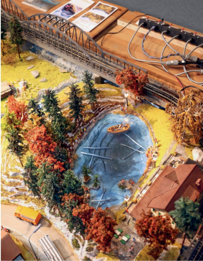
Auch auf der Anlage der BLS-Nordrampe zu sehen: der von Wald umgebene Blausee.