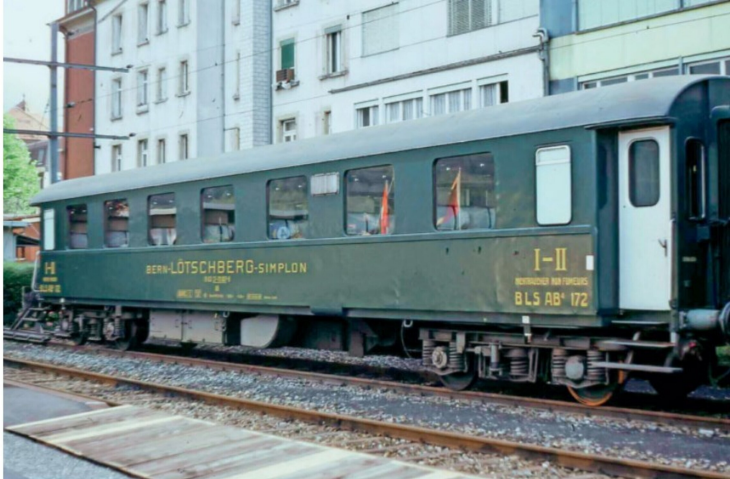
Der AB 40 172 des Rail In Club wartet 1988 in Interlaken West auf seinen nächsten Einsatz.

Firma: BUCO Spur 0 GmbH Tüfenbachstrasse 41 8494 Bauma Öffnungszeiten: Donnerstag, 9.00–17.00 Uhr Telefon: 052 386 17 77 Internet: www.buco-gmbh.ch