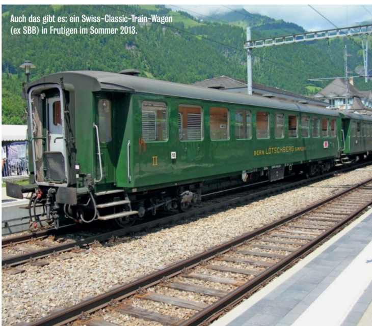
Auch das gibt es: ein Swiss-Classic-Train-Wagen (ex SBB) in Frutigen im Sommer 2013.