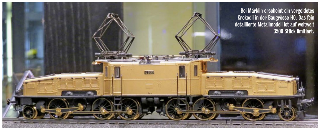
Bei Märklin erscheint ein vergoldetes Krokodil in der Baugrösse H0. Das fein detaillierte Metallmodell ist auf weltweit 3500 Stück limitiert.