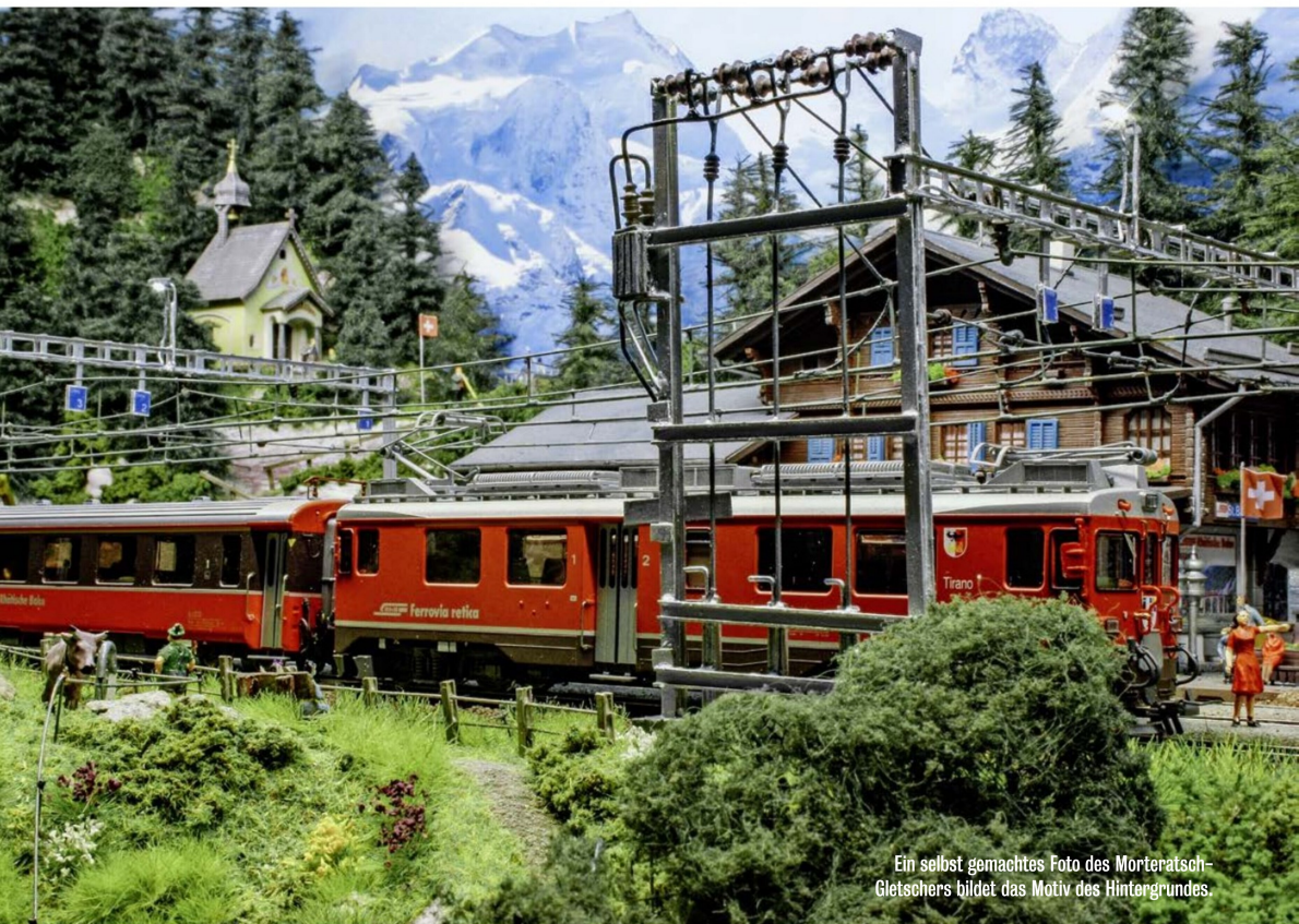
Ein selbst gemachtes Foto des Morteratsch-Gletschers bildet das Motiv des Hintergrundes.