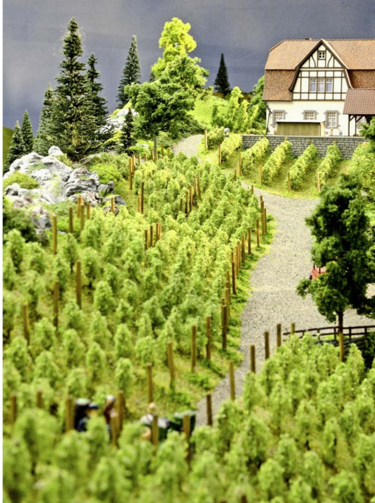
Schön gestaltete Detailszenen, hier eine Weinbergregion. Weitere Landschaften sind am Entstehen.