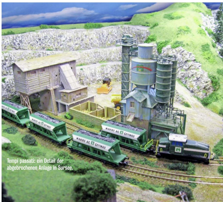
Tempi passati: ein Detail der abgebrochenen Anlage in Sursee.

Öffnungszeiten und weitere Infos: www.meks-schenkon.ch