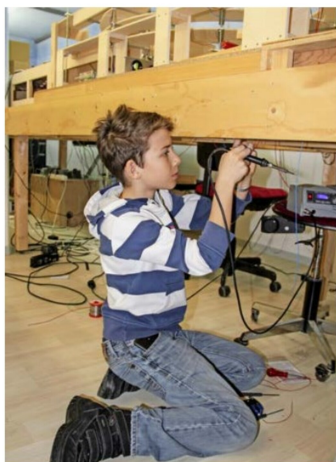
Dem MEKS ist die Nachwuchsförderung wichtig.