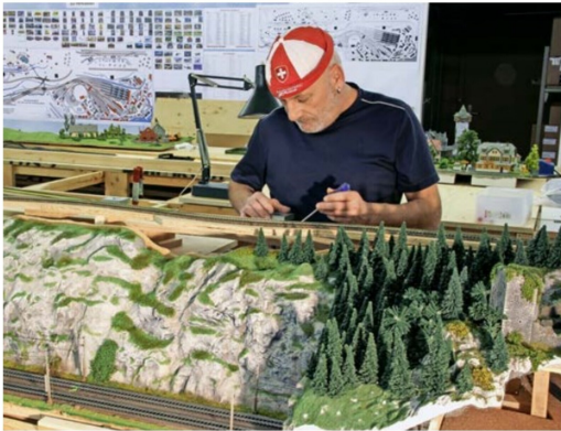
Alle Vereinsmitglieder zogen mit Schwung und Elan mit ...