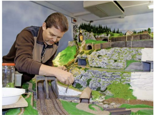
... was die Kameradschaft unter den Hobbykollegen noch mehr förderte.