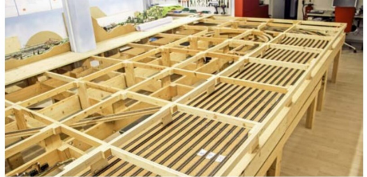
Sofort begannen die Mannen mit den Schreinerarbeiten am Grundrahmen ...