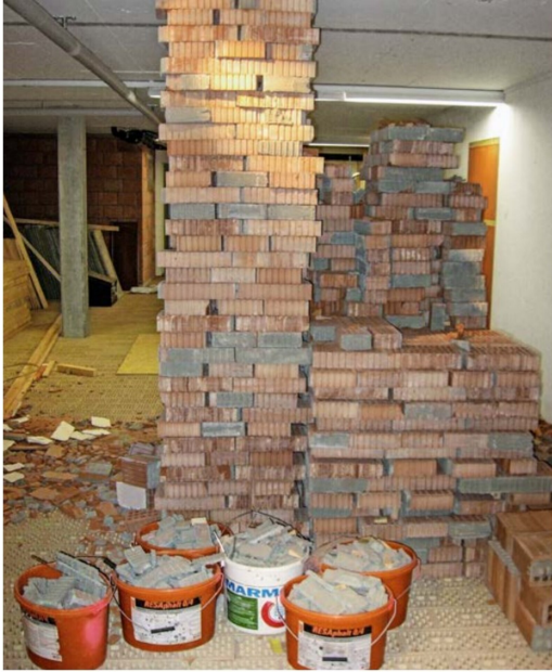
Die Umbauarbeiten im neuen Domizil dauerten mehrere Monate.