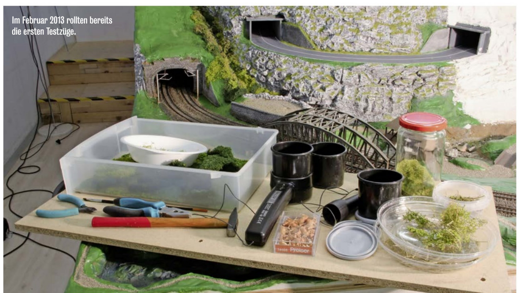
Im Februar 2013 rollten bereits die ersten Testzüge.