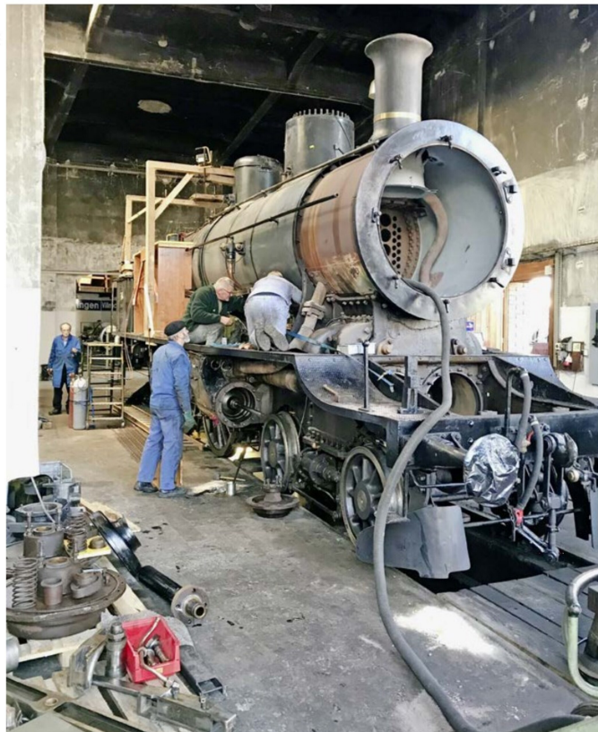
Anlässlich der Revision der A 3/5 705 wird die Lok komplett zerlegt, hier die innere Steuerung.