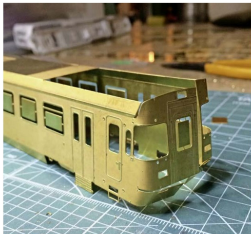
Das Gehäuse des Steuerwagens ist gebogen, aber noch nicht verlötet. Die Front der TPF-Endwagen ist in die Seitenwände integriert.