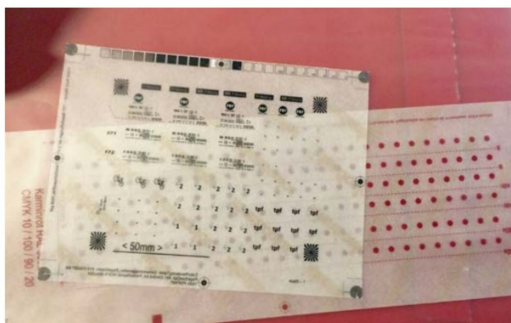
Die Abreibeschriftbögen für den TPF-Pendelzug liegen zur Verwendung bereit. Es werden schwarz-weiße und rote Beschriftungen benötigt.