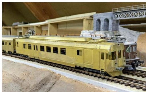
Es folgen erste erfolgreiche Testfahrten des Pendelzuges im Rohbauzustand auf der Modellbahnanlage des Königer Eisenbahnklubs (KEK).