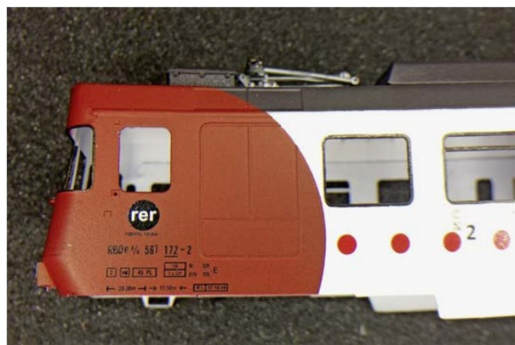
Die Beschriftung des Triebwagens ist bereits appliziert.