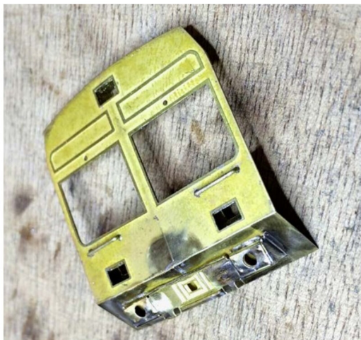
Im Gegensatz zur TPF-Ausführung wird die Front der BLS als separate Baugruppe hergestellt. Sie wird stirnseitig auf den Wagenkasten gelötet.