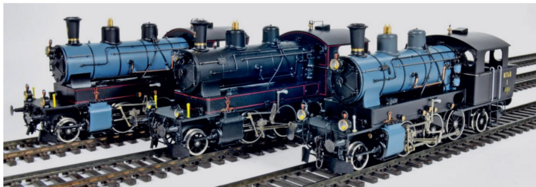
Aufstellung aller drei Lokvarianten der MThB Ec 3/5. Die Modelle überzeugen dank ihren filigranen und originalgetreuen Nachbildungen.