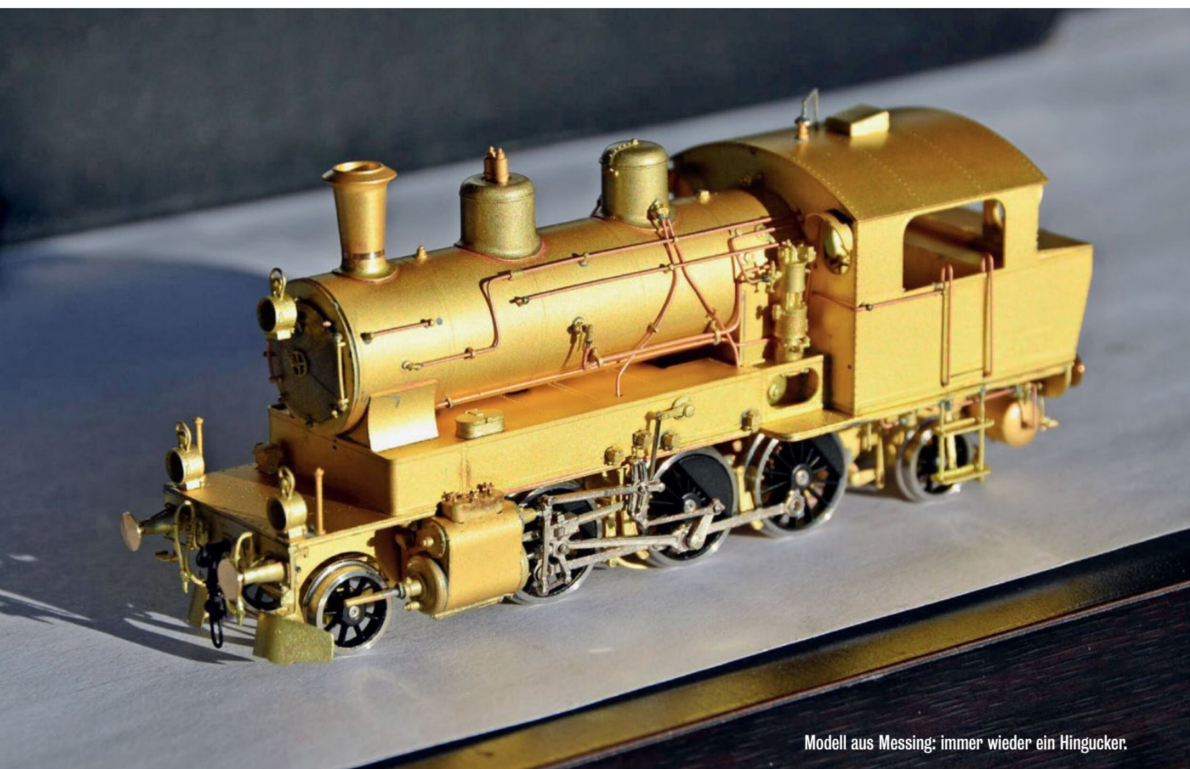
Modell aus Messing: immer wieder ein Hingucker.