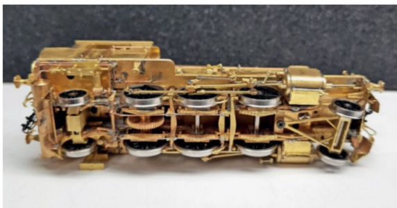
Die Untersicht des Fahrwerks dokumentiert links die Adamsachse und rechts die Deichselachse wie auch das Bremsgestänge und die Federung.