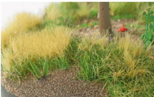
Eine Farnpflanze kann relativ schnell hergestellt werden, indem man vier Blätter in ein Loch im sandigen Bereich des Dioramas steckt.