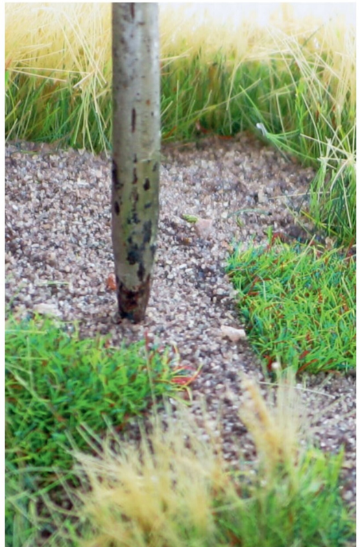
Die Löcher für den Baumstamm und die Pflanzen auf dem Diorama wurden von einer sehr spitzen Ahle aus meinem Werkzeugkasten gemacht.