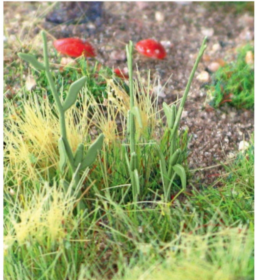
Vielfältige Vegetation aus Kunststoffpflanzen, bemalten Pilzen und Grasbüscheln.