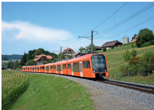
August Am 7. August erfolgt die Überfuhr der ersten Worbla-Einheit Be 4/10 01 zusammen mit den NeXt RABe 4/12 21 nach Worbl Dorf.