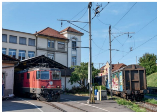
Juli Fahrzeuge mit normalem Lichtraumprofil sind im Seetal selten. Am 30. Juli rangiert die Re 420 254 der SBB Cargo in Hochdorf.