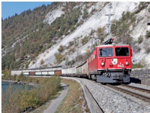
Oktober Munter fahren sie weiter im Planbetrieb: die Ge 4/4' der RhB, hier die Ge 4/4' 603 am 23. Oktober mit einem Güterzug bei Trin.