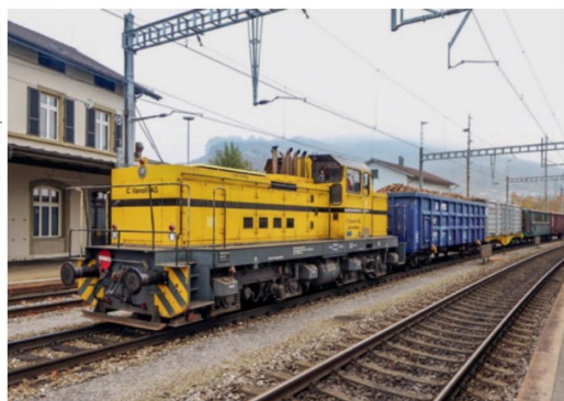
November Der Zuckerrübenverkehr 2018 erfolgt erstmals nicht durch die SBB: Am 4. November rangiert die Vanoli Bm 847 853-9 in Oensingen.