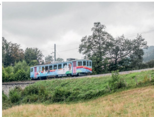
September Die Chemin de fer Yverdon–Ste-Croix (YStC) feierte ihren 125. Geburtstag: So verkehrt am 2. September der Be 4/4 5.