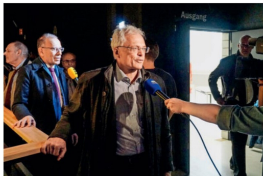
Die Schaffhauser Ständeräte Hannes Germann (l.) und Thomas Minder (r.).