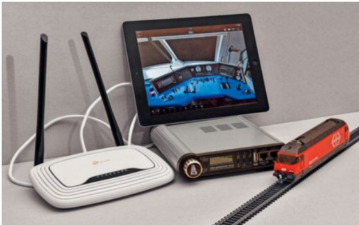
Die Hardwarekonfiguration für den Betrieb im Client-Modus. Die Lok wird über die animierten Hebel und Taster auf dem Tablet gesteuert.