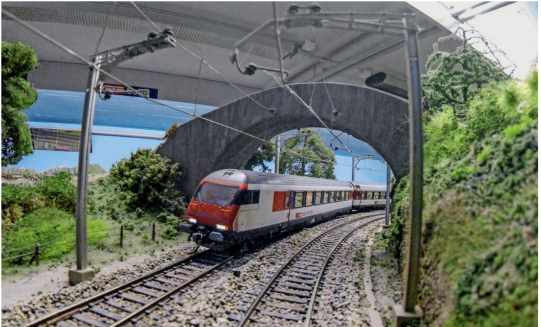
Blick aus dem Führerstand im Host-Mode. Die Kamera überträgt die Fahrt live auf den Bildschirm (das Foto wurde mit GoPro Hero4 erstellt).