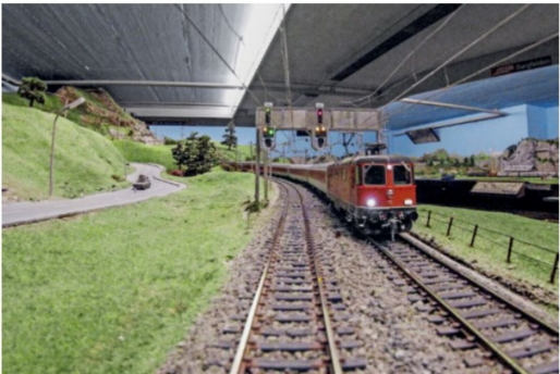
Mit dem Blick aus dem Führerstand wird das Fahren nach vorbildlichen Signalbegriffen möglich (das Foto wurde mit GoPro Hero4 erstellt).