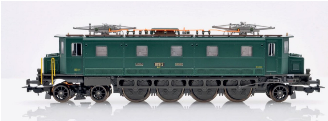
Umgedreht zeigt sich das Bild der Lokomotive anders. Es handelt sich um die Antriebsseite mit dem legendären Buchli-Antrieb.