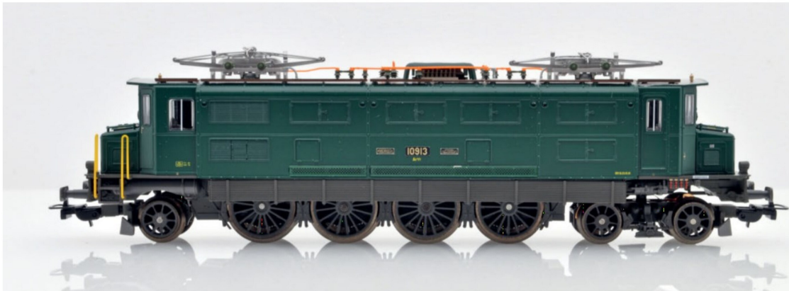
Die Maschinenraumseite der SBB Ae 4/7 10913. Nebst den überzeugenden Formen fallen auch die Kühlerschlangen positiv auf.