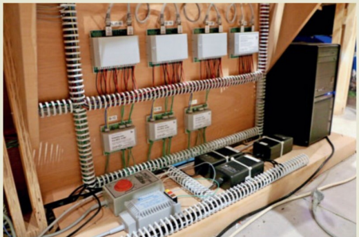
Unten die Transformatoren für verschiedene Stromversorgungen und Verstärker. Darüber Feedback-Module und Decoder für Weichenmotoren.