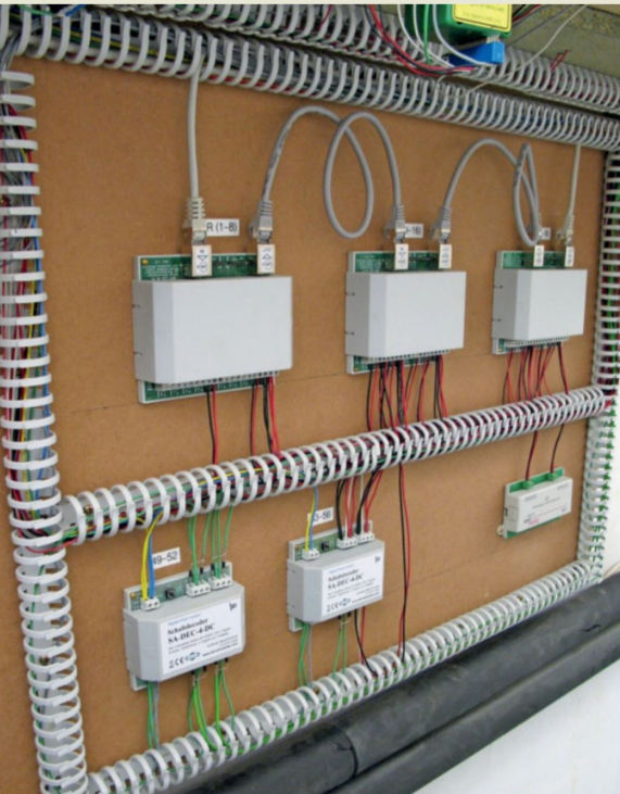
Elektrische Stationsschalttafel: die Rückmeldemodule, darunter zwei Decoder zur Steuerung der Weichen und schliesslich das Lenz-Kehrschleifenmodul.