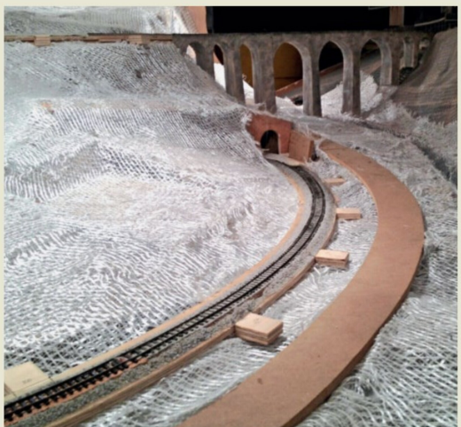
Die vorgeformte Landschaft im Zustand vor dem Auftragen des Harzes.