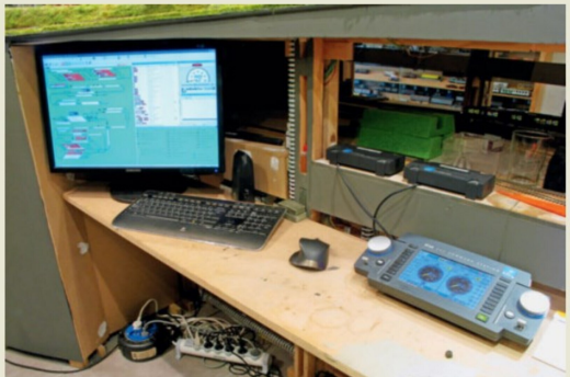
Steuergerät mit ESU-ECoS-PC, digitaler Steuereinheit und zwei Boostern.