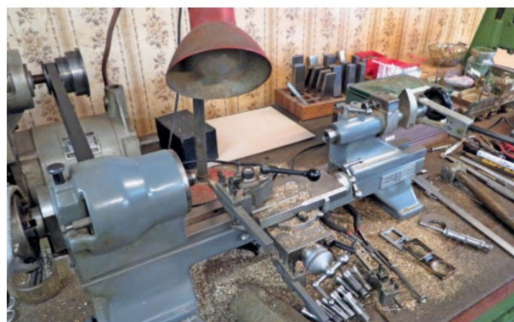
Handwerkskunst: In dieser Werkstatt wird noch analog gearbeitet.