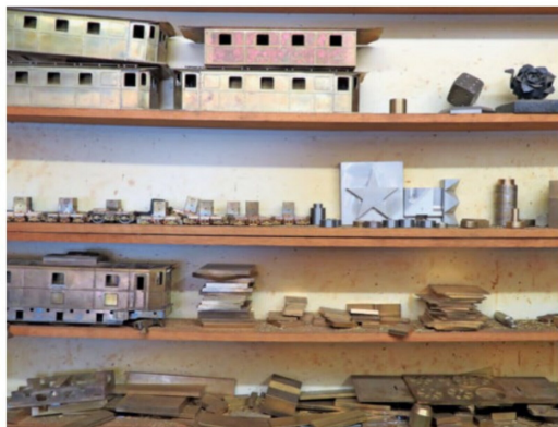
Messing, Neusilber und rostfreier Stahl sind die Hauptwerkstoffe.