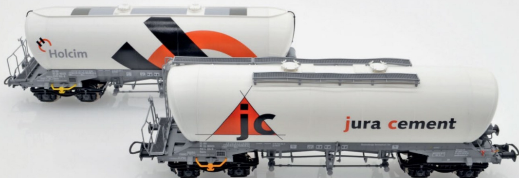
Der Holcim-Wagen verfügt, im Unterschied zum Wagen der jura cement, über keine Laufstege oben auf dem Silo.