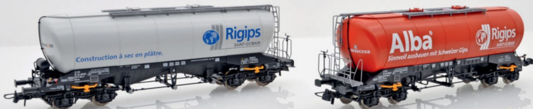
Die Rigips-Uacns sind jeweils auf der einen Seite in deutscher und auf der gegenüberliegenden in französischer Sprache vorbildgerecht beschriftet.