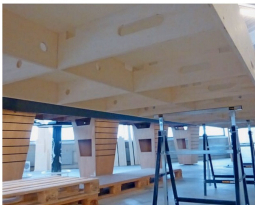
Der Blick auf die Unterseite der Segmente des neuen Abstellbahnhofs.