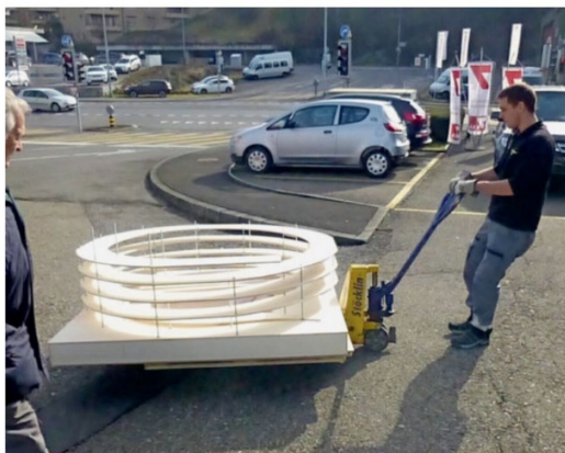
Die neue, gesponserte Gleiswende wird soeben entgegengenommen.