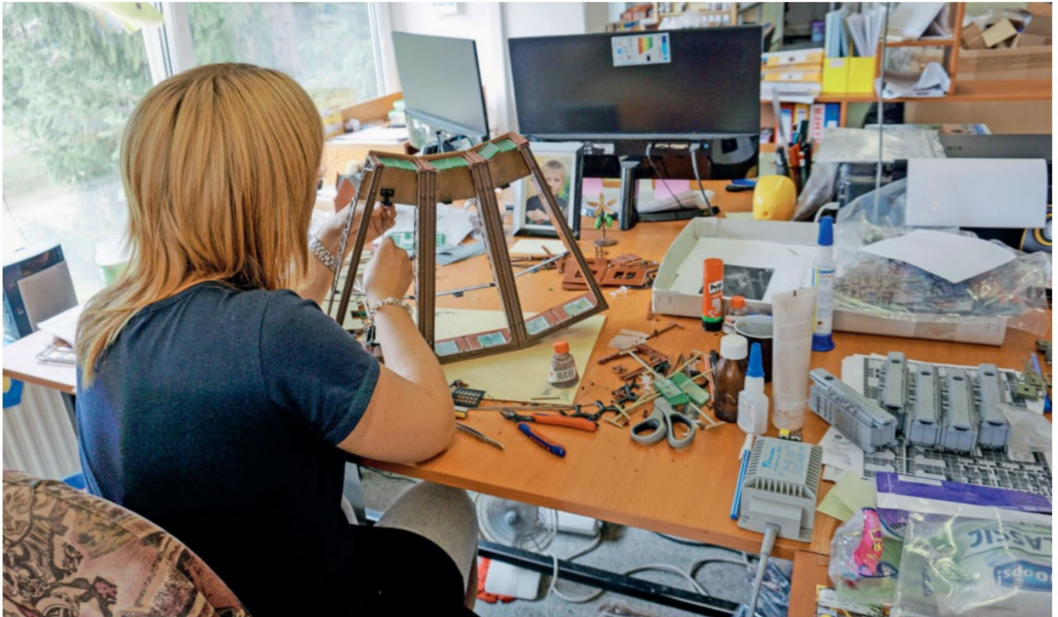
Bevor ein Modell in Serienproduktion geht, wird es hier zusammengebaut. Passt alles noch zusammen? Muss die Bauanleitung überholt werden?