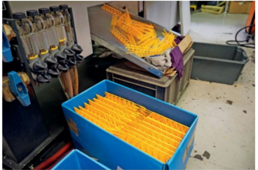
Teile eines Krans. Zu diesem Zeitpunkt sind die Produkte noch heiss.