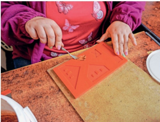
Ein Blick in die Steingutproduktion. Hier wird alles von Hand hergestellt.