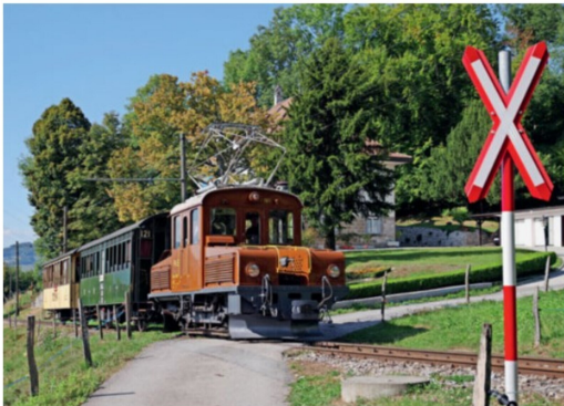
Im Frühling 2018 noch undenkbar, die Ge 2/2 161 in Museumsbahndiensten.