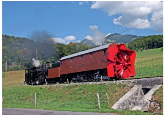
Auch anlässlich dieses Fests fertiggestellt wurde die RhB-Schneescheider.