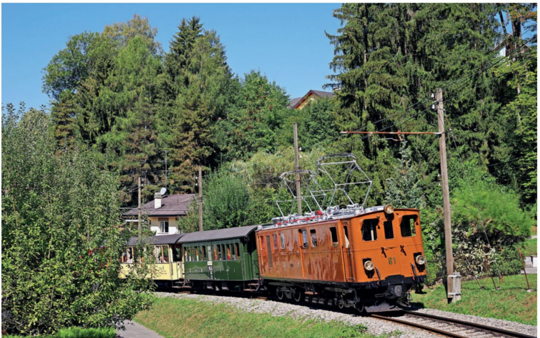
Die frisch restaurierte Bernina-Lok Ge 4/4 81 zusammen mit allen den der BC gehörenden, ehemaligen Bündler Personenwagen RhB AB 121 und BB As 2.