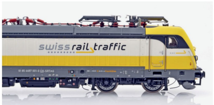
Das SRT-Logo ist ebenso wie alle anderen Anschriften lupenrein am Kasten aufgedruckt.

Im Katalog 2015 kündigte ACME erstmals die Modelle der BR 187 an. 2016 wurde zusätzlich die Version der SRT Rem 487 001 als exklusives Modell für den Schweizer Markt ins Programm aufgenommen. Leider dauerte es danach mehr als zwei Jahre, bis die ersten Loks ausgeliefert wurden. Die Gründe dafür sind vielfältig und wurden