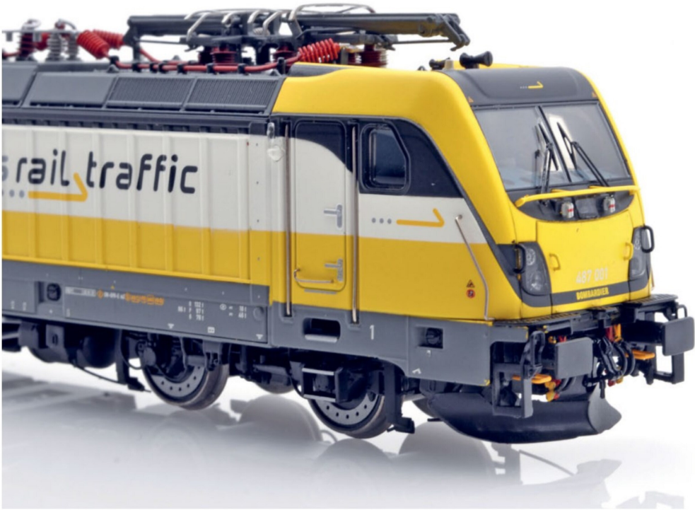
Die mit Bremsschläuchen und Zughaken zugerrüstete Seite (Führerstand 1) der Rem 487 001 im Auslieferungszustand ab dem ACME-Werk.

stellte sich das Problem, dass teilweise im Monatsrhythmus Loks mit Folie des neuen Mieters beklebt werden mussten. Daher entwickelte Bombardier das sogenannte Flex-Panel-System, welches im Wesentlichen aus einer gespannten Lkw-Plane besteht. Damit war es möglich, der Lok innert weniger Stunden mit einem vergleichsweise kleinen Aufwand ein völlig neues Aussehen zu verleihen. Wenn kein Flex-Panel eingesetzt ist, kommt der einem Wellblech ähnliche Lokkasten zum Vorschein.