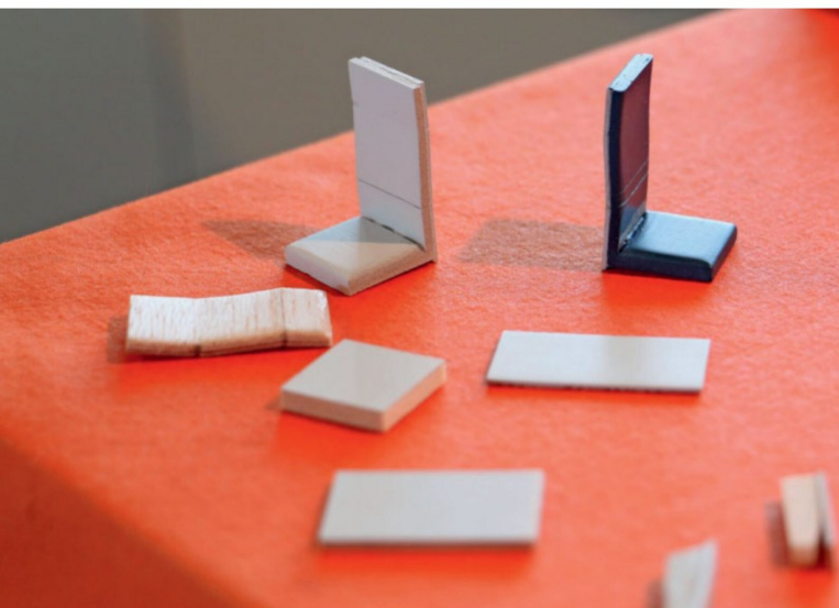
Viel Handarbeit steckt auch im Mechanismus für die Türschliessung und in den gewölbten Sitzen.