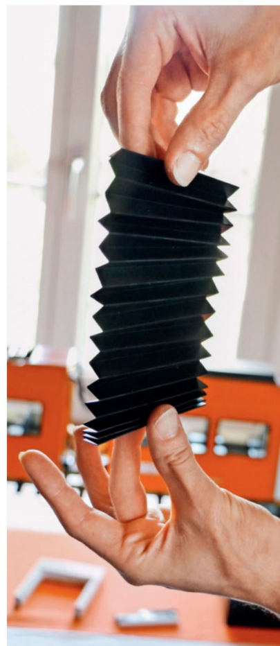
Aus Gummimaterial, das erhitzt und gefalzt wird, hat Aeschmann diesen Faltbalg entwickelt, der als Verbindung zwischen den Wagen montiert wird.