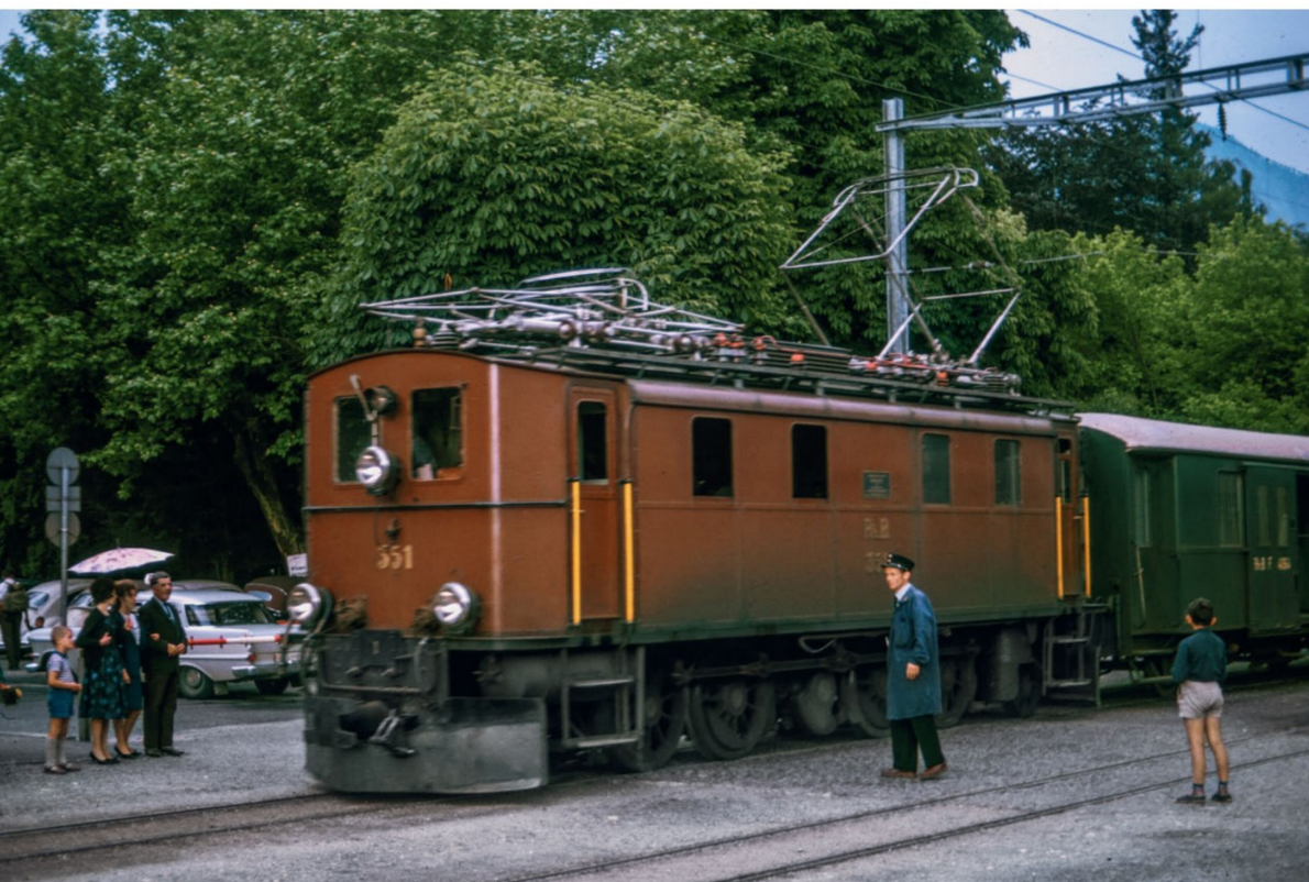
Die Ge 4/6 351 im Oktober 1964 in Landquart. Bis 1974 waren die Landquart «Perrongleise» auf Schienenhöhe mit Pflastersteinen eingedeckt.

Stämpfli AG, Postfach 8326, CH-3001 Bern, Tel. +41 (0)31 300 62 58, Fax +41 (0)31 300 63 90, leserservice@loki.ch oder im Webshop auf www.loki.ch