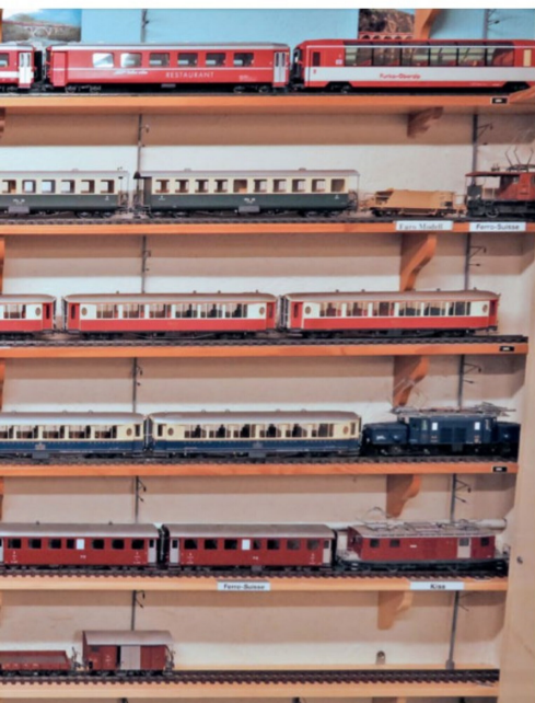
stellern erwartet den Besucher des Kleinmuseums.