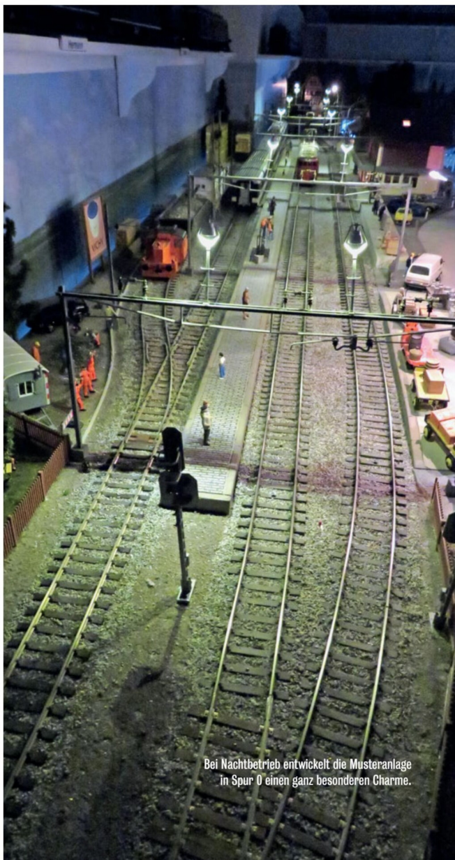
Bei Nachtbetrieb entwickelt die Musteranlage in Spur 0 einen ganz besonderen Charme.