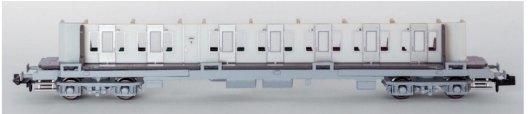
... und der Gangseite her gesehen.