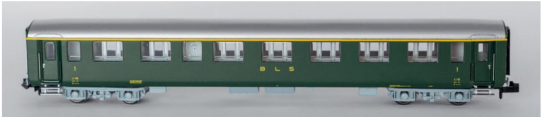
Der Epoche III A 192 mit grünen Türen und SIG-Torsionsstabdrehschellen...