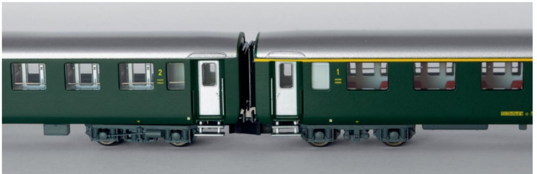
Mit Kurzkupplungen (peho) resultiert ein enger Abstand.