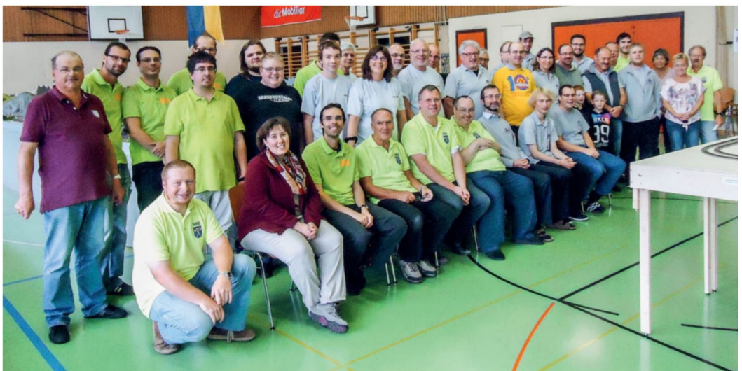
Die Mitglieder der Mörieger Kellerbahn mit ihren Gästen und Helfern nach der Ausstellung 2016, an der etwa 700 Besucher gezählt wurden.