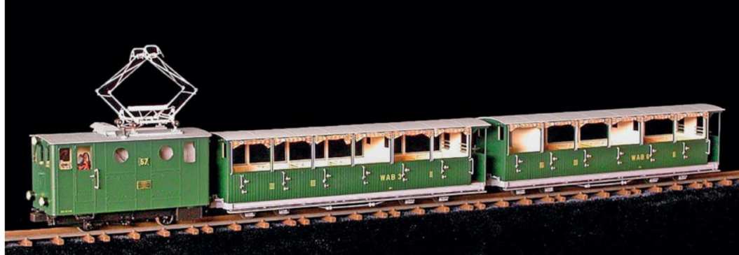
Dieser schöne Oldtimerzug ist noch erhältlich. Die Lok He 2/2 57 und die Wagen BC4 3 und 6 können bei der WAB, aber auch bei der SPB eingesetzt werden.