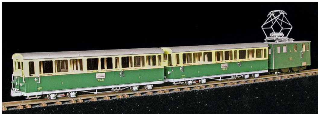
Noch erhältlich sind die Lokomotive He 2/2 61 mit den Personenwagen AB 36 und 37 als waschechter WAB-Zug. Der Einsatz im Vorbild war ca. 1966 bis 1982.