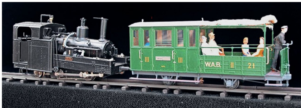
Ein WAB-Zug mit dem speziellen Wagen BCF 21 für die Vor- und Nachsaison. Detailreich und mit viel Liebe gebaut. Das Modell steht nicht mehr im Verkauf.