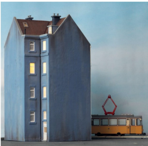
Durch die akribische Alterung ist die Rückseite des Eckhauses ebenfalls attraktiv anzuschauen und wirkt für den Betrachter sehr realistisch.