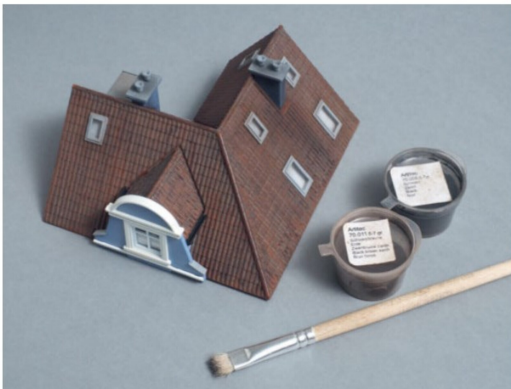
Auf dem Hausdach wurden die eingebauten Klappfenster mit dunkelbraunen und die beiden Kamine mit schwarzen Pigmenten gealtert.