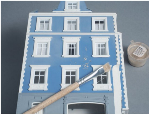
Für das Altern und das gleichzeitige Aufhellen des etwas dunklen Blaus der Fassade wurden die Farbpigmente «Steinkreide» verwendet.