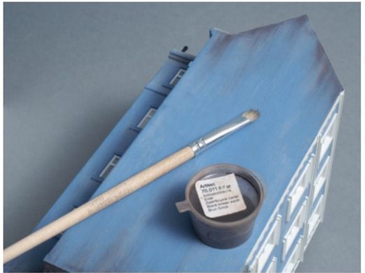
Die stärkeren Verschmutzungen, wie z.B. Verfärbungen durch Wasserläufe, entstanden mit «schwarzbrauner Erde» von oben und von unten.