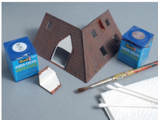
Das Hausdach erhielt im Anschluss eine zweite Lasur mit erdbrauner Farbe. Danach wurde das Dach auf der Innenseite weiss angestrichen.