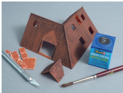
An den Dachteilen mussten die Öffnungen für die Klappfenster ausgeschnitten und eine erste Lasur in schwarzer Farbe aufgebracht werden.