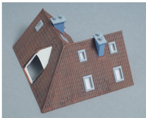
Zwischenzeitlich wurden die Klappfenster «verglast» und in die vorbereiteten Dachteile eingeklebt sowie die beiden Kamine montiert.