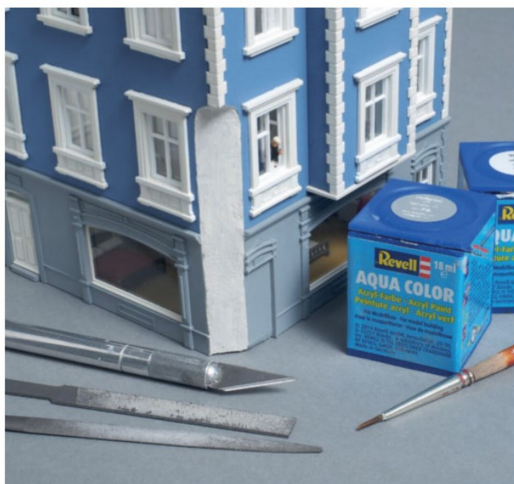
Mit Feilen und Skalpell erhielt die Hausecke ihre endgültige Form und schliesslich mit einer grauen Farbe den definitiven Anstrich.