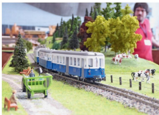
Hübsche Anlage der Eisenbahnfreunde RBS aus Worblaufen.