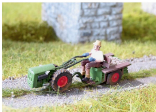
Kein Detail zu klein, um vor die Linse der LOKI-Kamera zu kommen.