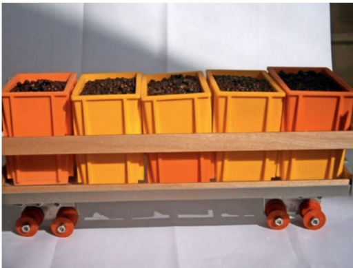
Auf den Anhänger kommen die Erntebehälter im Massstab 1:6.