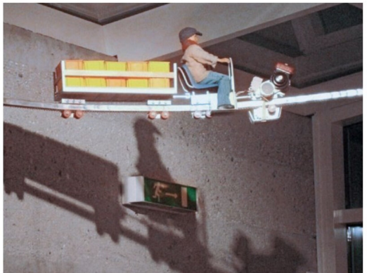
Die verkleinerte Weinbau-Monorail dreht nun munter ihre Runden.