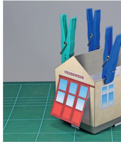
Zur Verstärkung wurden mit Kartontücken seitliche

bilität. Wen die Muse gepackt hat, der kann noch die gesamte Inneneinrichtung analog den Fassaden gestalten, worauf wir ebenfalls verzichtet haben. Eine aus grauem Papier zusammengeklebte Rampe und der zusätzliche Türgriff beenden diese zusätzlichen Aufwände.