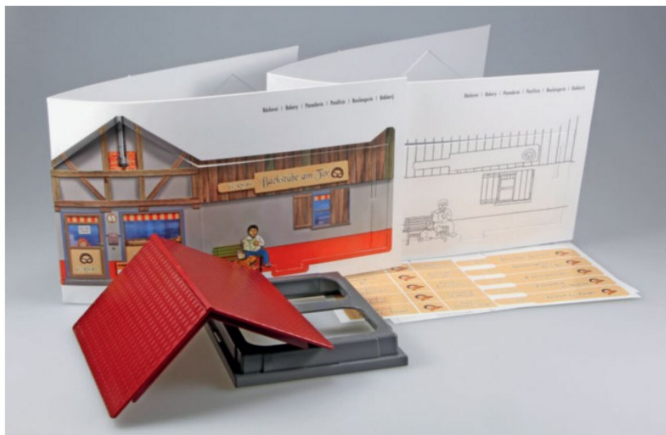
Alle Bauteile des Bäckereibausatzes auf einen Blick. Wer will, kann seine Bäckerei auch umtaufen.

Die bei der Internetsuche gefundenen Grafikelemente fügt man Schritt für Schritt in die selbst gestaltete Vorlage ein. Da darf