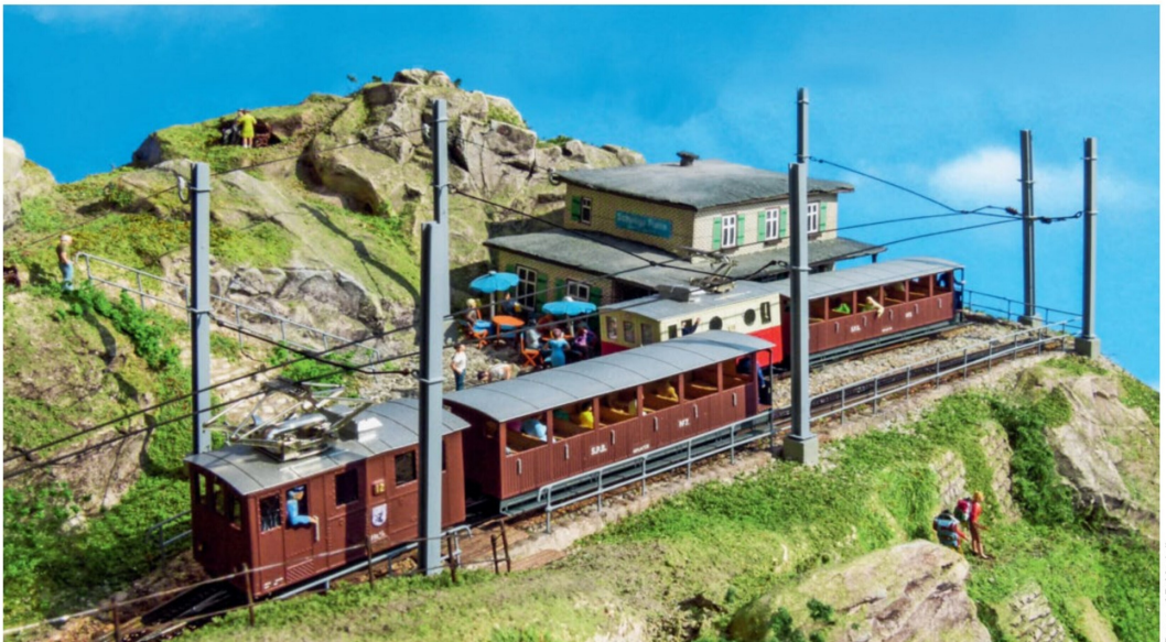
Der Sommer ist der richtige Zeitpunkt, um den Alpengarten auf der Schynigen Platte zu besuchen. Er ist in nur wenigen Minuten zu Fuss zu erreichen.