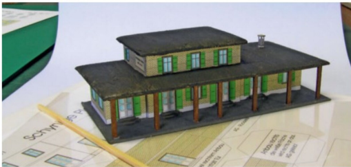
Mit etwas Glück kann man diesen Bastelbogen noch ergattern.

Abfahrt ab Wilderswil, Teilnehmerzahl beschränkt auf 40 Personen pro Fahrt.