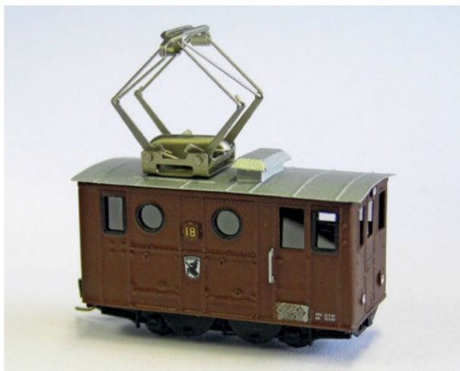
Mit den runden Fenstern zeigt die He 2/2 18, dass sie von der WAB stammt.