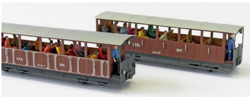
Die beiden Möglichkeiten bei den offenen Wagen: die B 3, 6 oder 7 mit oder ohne Filets.