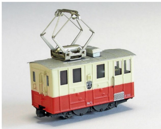
Die He 2/2 11 trägt das Wappen von Wilderswil und ist eine echte SPB-Lok.