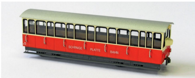
Für die modernen Wagen mit den einheitlichen Wagenkästen fährt der B 43, Baujahr 1992.