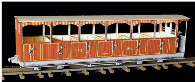
Dieser schöne Oldtimer wurde 2013/2014 als Set mit einer grün-rot-schwarzen Lok verkauft.