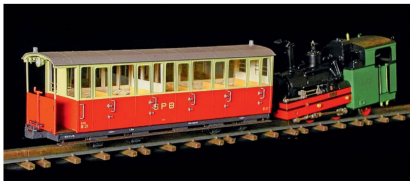
Dieser Zug im Zustand 1970–1995 ist heute bei H-R-F in kleiner Stückzahl noch lieferbar.