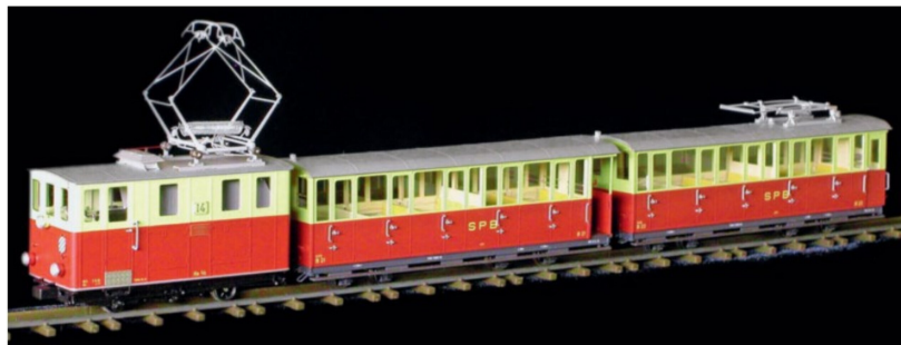
Der schöne, einheitliche Zug mit Lok Nr. 14 und den Wagen B4 21 und 22 wurde 2014/2015 verkauft.