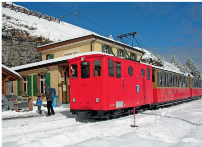
Kein Winterbetrieb, sondern verfrühter Schneefall auf der Schnige Platte im Oktober 2009.