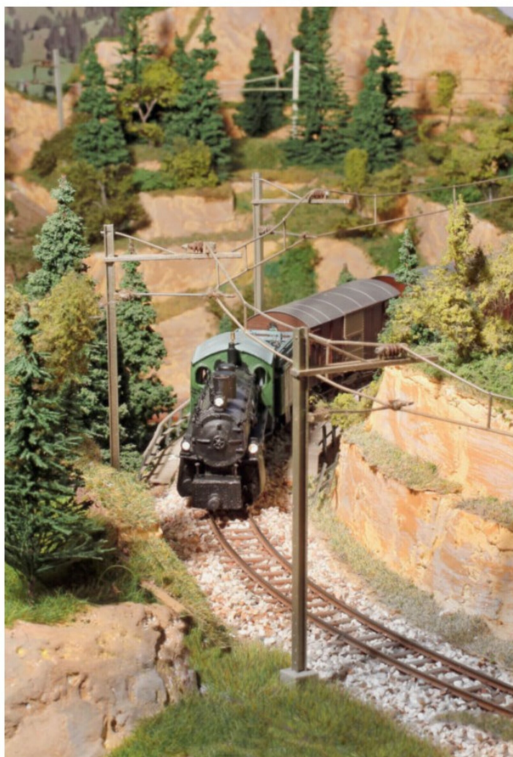
Traktionswechsel. Die Schleppenderlok G 4/5 108 kommt uns hier entgegen.