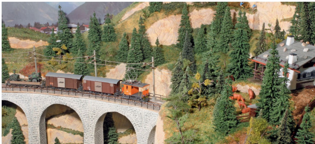
Es müssen nicht nur die «Starzüge» den Kunstbau befahren, ein Rangiertraktor mit einem kurzen Übergabezug ist gleichfalls schön.