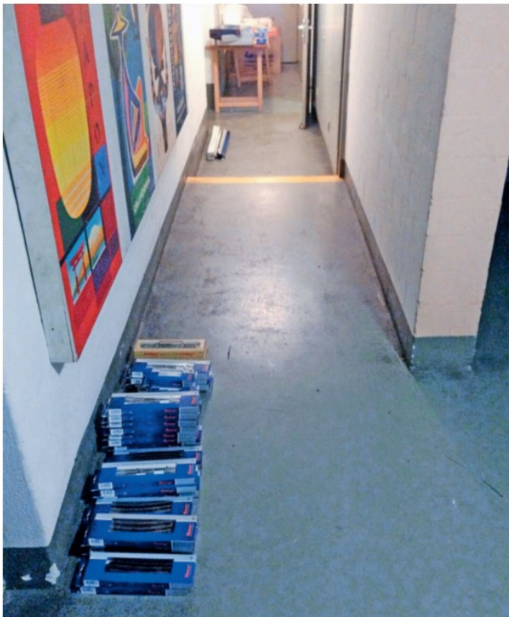
Nach und nach wird alles ausgeräumt und im Flur zwischengelagert.