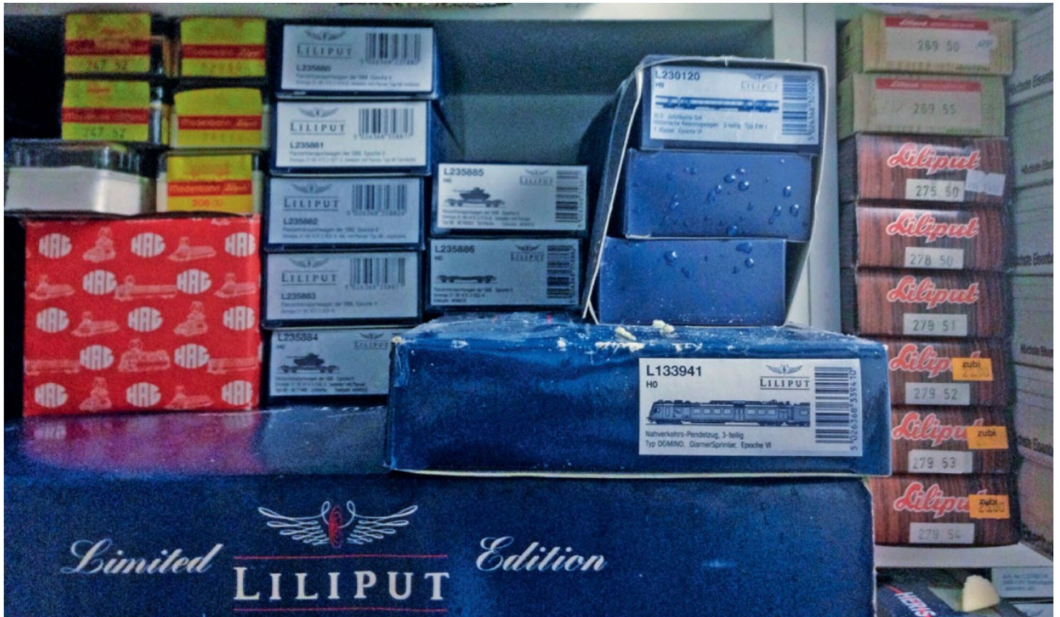
Die mit Wasser aufgesaugten Modellbahn-Verpackungen weisen beinahe alle Deformationen auf. Hier gilt es, mit entsprechender Vorsicht zu walten.