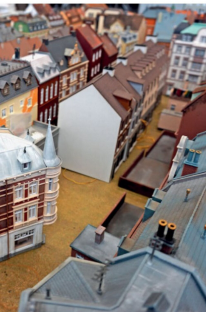
Schaffhausen im Massstab H0 bilden.