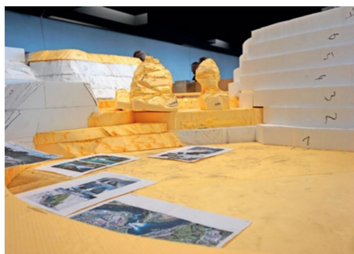
Kaum zu glauben: Daraus entsteht der Rheinfall samt Schloss Laufen.