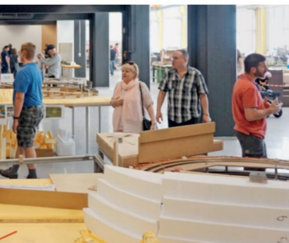
dem altherwürdigen SIG-Areal in Neuhausen.