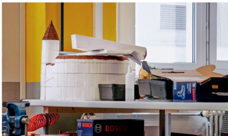
Der Munot – die Festung ist das Wahrzeichen von Schaffhausen – noch im Rohbau.