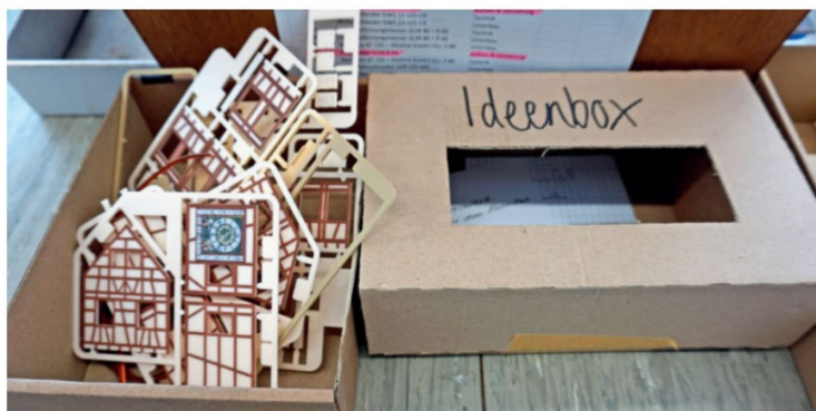
Neben handwerklichem Geschick sind bei Smilestones auch Kreativität und Ideenreichtum gefragt.