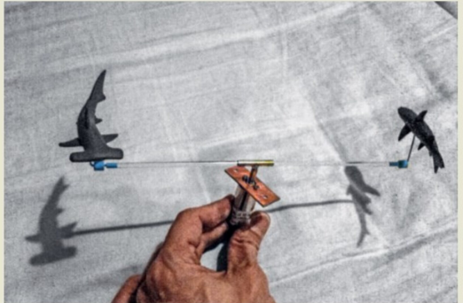
Mittels eines Karussells schwimmen die beiden Haie im Kreis.