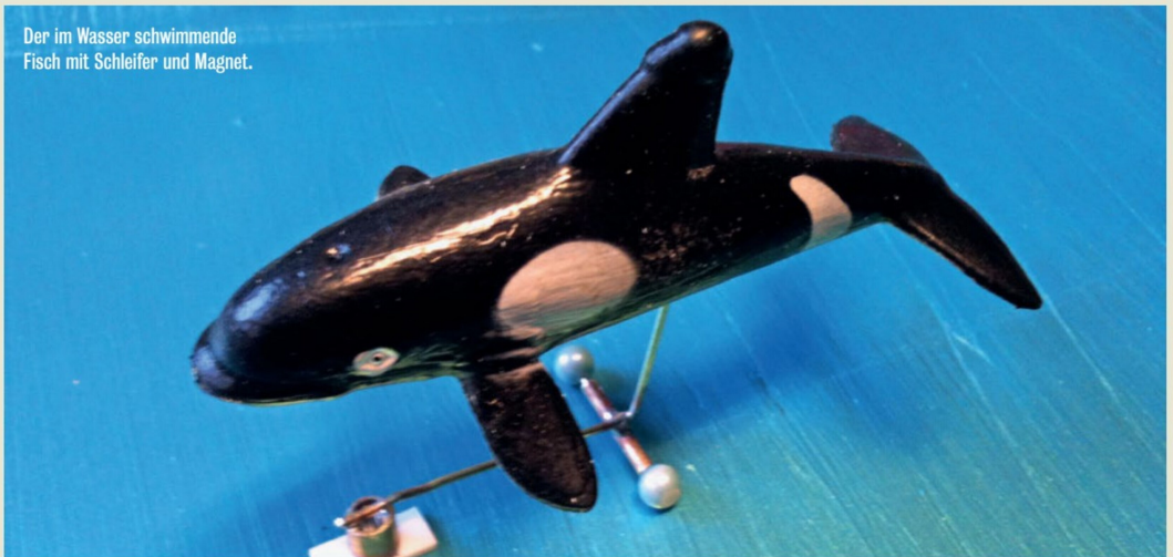
Der im Wasser schwimmende Fisch mit Schleifer und Magnet.