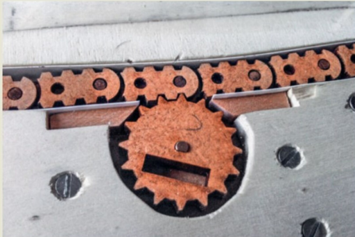
Die Kette mit Antriebszahnrad vor dem Abdecken durch den «Meeresgrund».