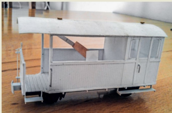
Der Aufbau vom Vorstellwagen mit den Details entstand aus Polystyrol.