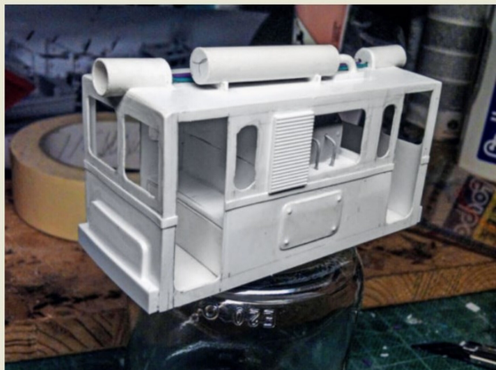
Auch die Grubenbahnlok entstand aus Kunststoffplatten.