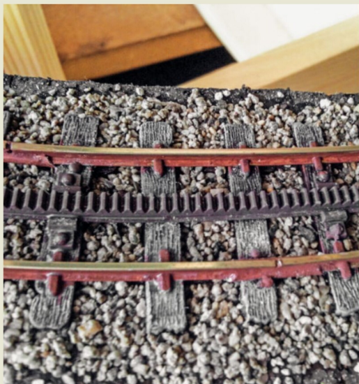
Das Einschottern der Gleise erfolgt mittels selbst gesiebten Schotters.