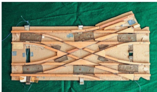
Diese Spezialweiche ist kaum SBB-tauglich, aber im Modell befahrbar.